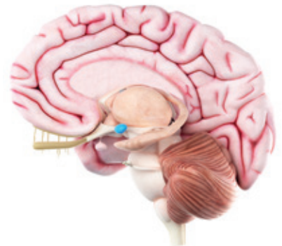
Die Amygdala im menschlichen Gehirn, blau gekennzeichnet.