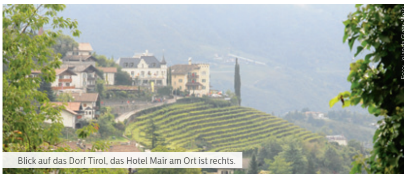
Blick auf das Dorf Tirol, das Hotel Mair am Ort ist rechts.

Hotel Mair am Ort Familie Prünster Schlossweg 10 39019 Dorf Tirol (IT) Tel. +39 0473 923315 info@mairamort.com www.mairamort.com