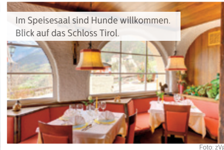
Im Speisesaal sind Hunde willkommen. Blick auf das Schloss Tirol.