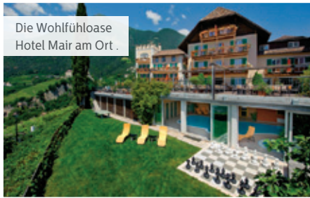
Die Wohlfühloase Hotel Mair am Ort