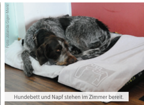
Hundebett und Napf stehen im Zimmer bereit.