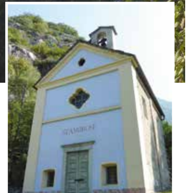
Die Kapelle St. Ambrosi.

Start und Ziel Parkplatz vis-à-vis der Kirche S. Ambrogio in Claro.