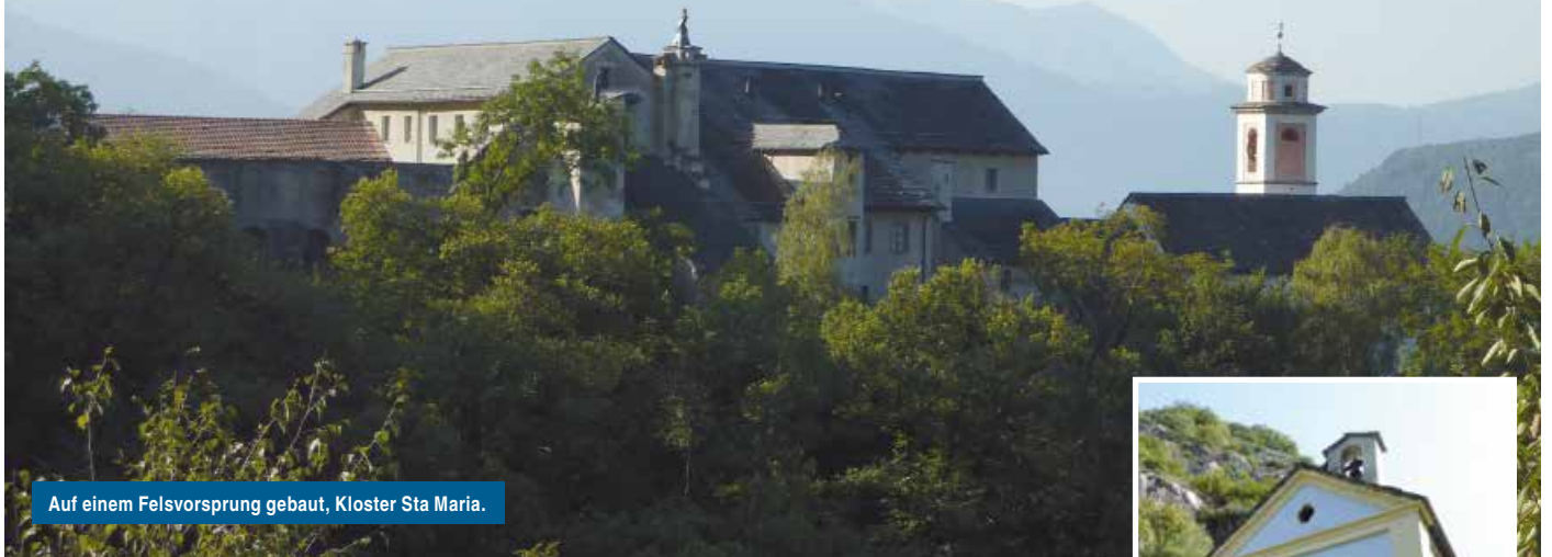
Auf einem Felsvorsprung gebaut, Kloster Sta Maria.