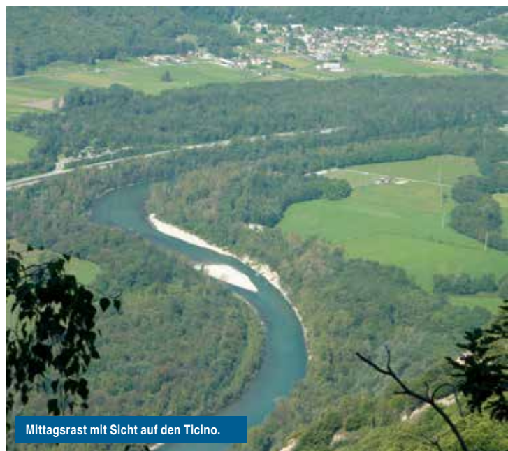
Mittagsrast mit Sicht auf den Ticino.